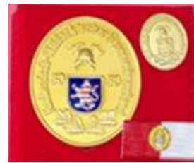
... in Gold -50-