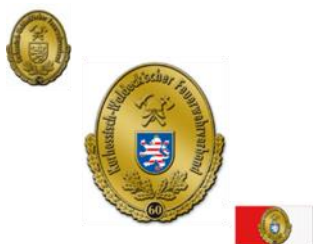
Plakette in Gold -60-