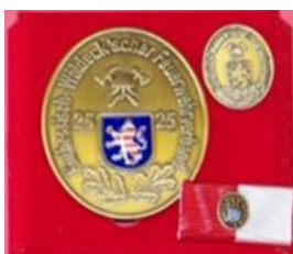
Plakette in Bronze (25 Jahre)

Es werden nur ehrenamtlich geleistete Dienstzeiten berücksichtigt.