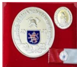
in Silber (40 Jahre)