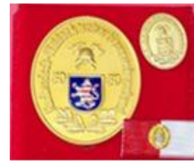
... in Gold -50-