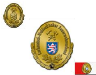
Plakette in Gold -70-