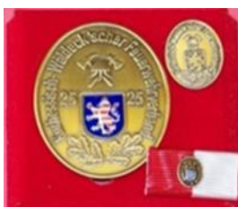
Plakette in Bronze (25 Jahre)

Es werden nur ehrenamtlich geleistete Dienstzeiten berücksichtigt.