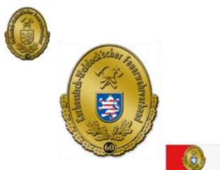
Plakette in Gold -60-